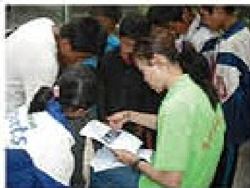
蜂业环保知识进课堂

中华蜂的工作特性决定了它对本地植物授粉的广度和深度都超过欧洲蜜蜂;中华工蜂每日出外采蜜的时间比欧洲工蜂早2-3小时,归巢时间却晚2-3小时;中华工蜂正常工作气温为7℃以上,而欧洲工蜂要在10℃-12℃时才能正常开始采蜜。很多本地植物的花期温度较低而必须由中华工蜂授粉,一旦中华蜜蜂退出某一地区,将直接影响了一部分植物繁衍,破坏了该地区亿万年来形成的生态体系。从而使植物种类多样性遭受破坏。