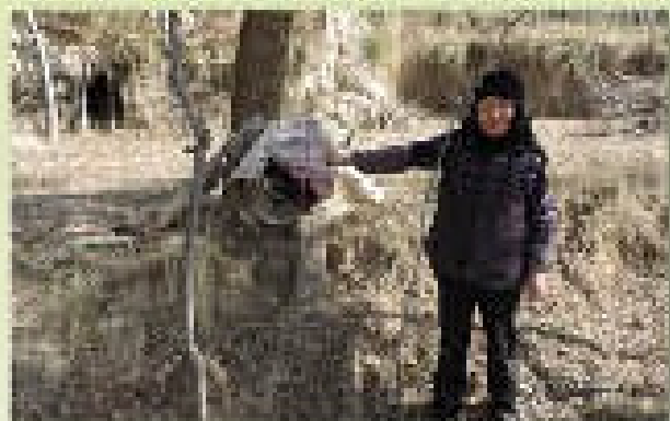
她们都是青海东方蜜蜂的保护种

作为优秀的授粉昆虫,经蜜蜂授粉的农作物,均可获得大幅度的增产。蜜蜂为农作物授粉的年价值是蜂产品产值的143倍。蜜蜂授粉可使玉米增产34%,荞麦增产40%,葡萄增产46%,果树增产50%,苜蓿草增产400%,西瓜增产170%。同时,蜜蜂传粉利于许多植物的生长,蜜蜂产业关系到当地生态环境的保护和改善,防止因植被退化造成的水土流失。