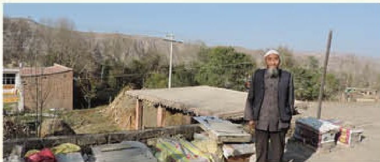
养殖方法先进,产量较高