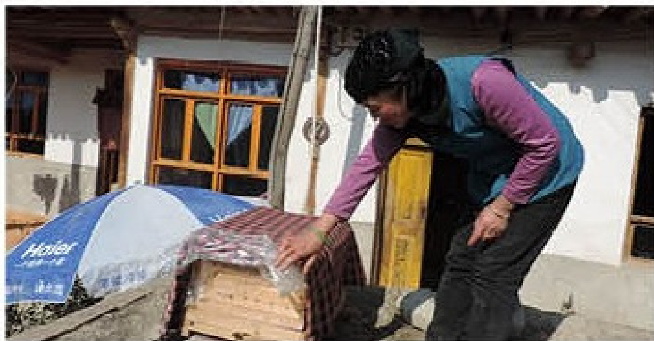
鼓励妇女参与养殖

中蜂的逃群主要的由于缺蜜、受巢虫危害、巢脾过老、发生病害、农药中毒、外界的干扰过度等原因引起的。中华蜜蜂是我国土著的“近祖型”应激反应强的蜂种。