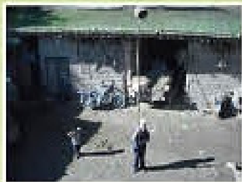
原始收集野生中蜂法