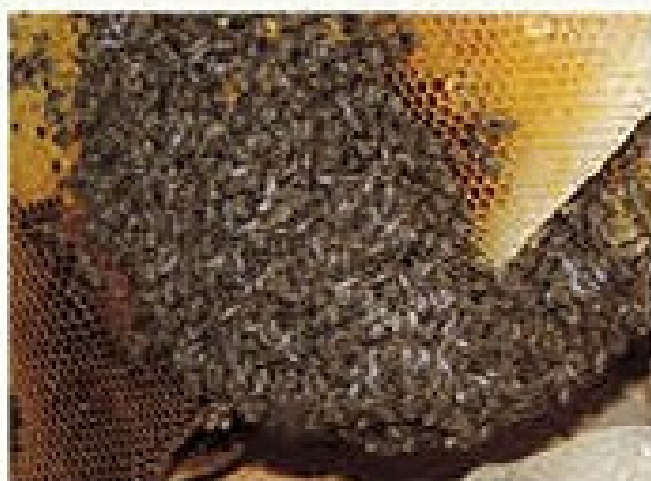
民和当地的中华蜜蜂