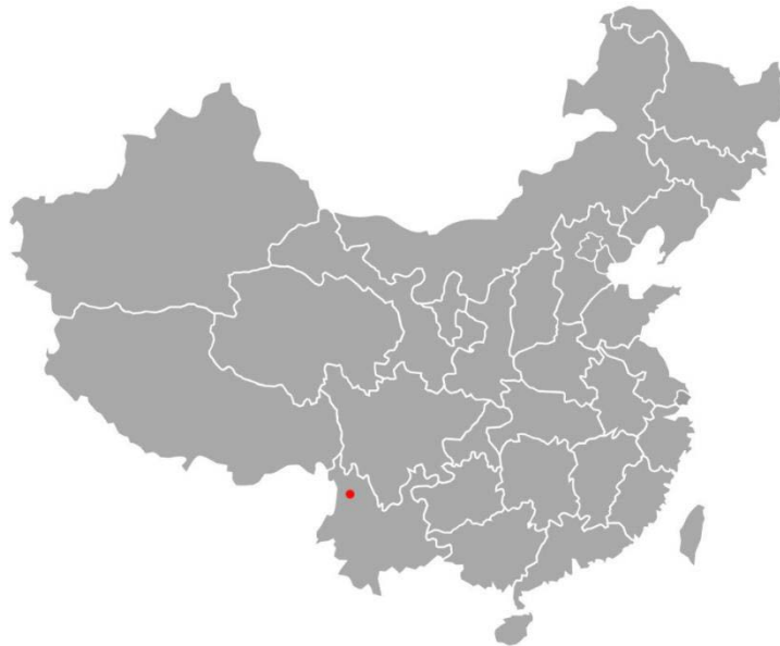
项目点在中国的位置

经度：26° 47' 58.8" N 纬度：99° 37' 43.1" E 海拔范围 2500 米-3500 米