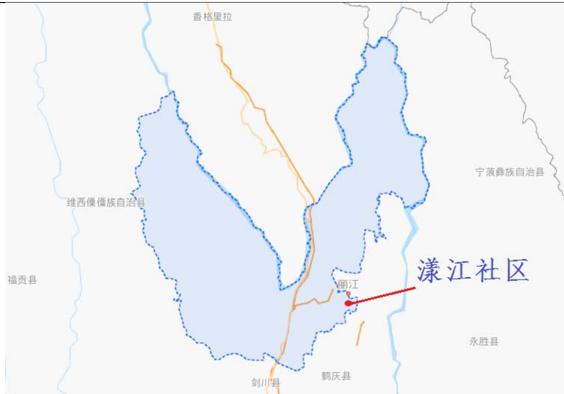
漾江社区在玉龙县的位置

No. of households: _____ No. of population: _____ Ethnic/Religious representation _____