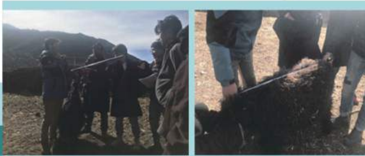
样本测量 Measurements མ་དཔེ་ཚད་འཇུག།

冬季天冷时，选择出生时间相同、身体机能几乎相同的牛犊，通过以往传统的养育方式和棚内养育方式进度养育管理；冬季的温棚是“育婴室”、“养老院”和“庇护所”。作为育婴室：