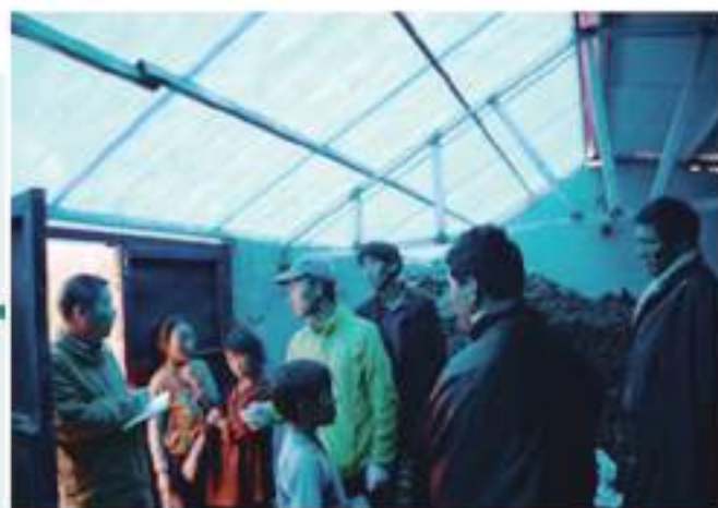
改建后的温棚与传统温棚采光对比

Comparison of lighting between the reconstructed greenhouse and the traditional greenhouse