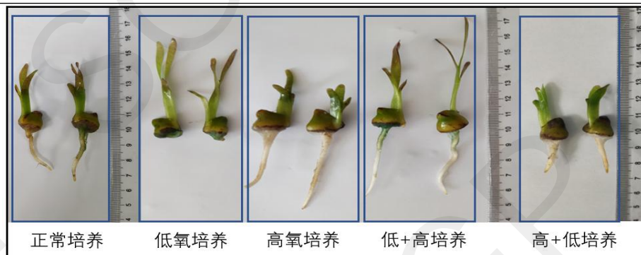
图 2 分别为正常、低氧或高氧培养 30 天，与“低+高”（15 天低氧+15 天高氧）和“高+低”（15 天高氧+15 天低氧）培养的有性苗对比