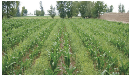
图2 玉米/豌豆间作模式田间长势