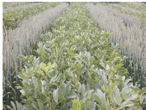
图4 小麦/蚕豆间作模式田间长势

（5）适时收获：一般情况下，小麦于7月上中旬收获，蚕豆于8月上中旬收获。小麦在蜡熟末期适时收获，等蚕豆荚发黄变黑既可收获。